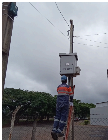
Figura 2 - Etiqueta RFID instalada internamente em painel metálico de EPC

O programa experimental do Projeto P-46 foi desenhado para validar a aplicação prática da tecnologia RFID em redes de gás natural, considerando as condições reais de operação urbana. Inicialmente, foram definidos ativos representativos para a fase piloto, abrangendo diferentes tipos de infraestrutura como válvulas de bloqueio, retificadores e estações de regulagem de pressão, em 16 municípios do interior de São Paulo. A seleção dos ativos levou em conta fatores como diversidade de localização (áreas residenciais, comerciais e industriais), acessibilidade e criticidade operacional. Para cada ativo selecionado, foram aplicadas etiquetas RFID UHF de alta resistência (Figura 2), desenvolvidas junto ao fabricante Acura/HID, e os procedimentos de registro envolveram a leitura da etiqueta via aplicativo Android, a captura de fotografia georreferenciada e o envio dos dados para o banco de dados em nuvem.