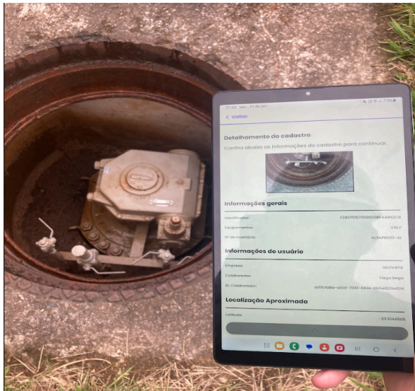
Figura 3 - Utilização da aplicação para cadastro de ativos em campo via etiqueta RFID

incluindo válvulas de bloqueio, retificadores e estações de regulação, com 100% dos registros associados a dados georreferenciados e imagens capturadas em campo. O aplicativo Android, desenvolvido para leitura das etiquetas RFID via Bluetooth (Figura 3), demonstrou estabilidade e facilidade de uso, permitindo a sincronização em tempo real dos dados coletados com o banco de dados em nuvem. Durante a operação assistida, a taxa de sucesso nas leituras com leitor RFID móvel foi superior a 90% em ambientes urbanos dentro ou fora da via pública, resultado considerado satisfatório.