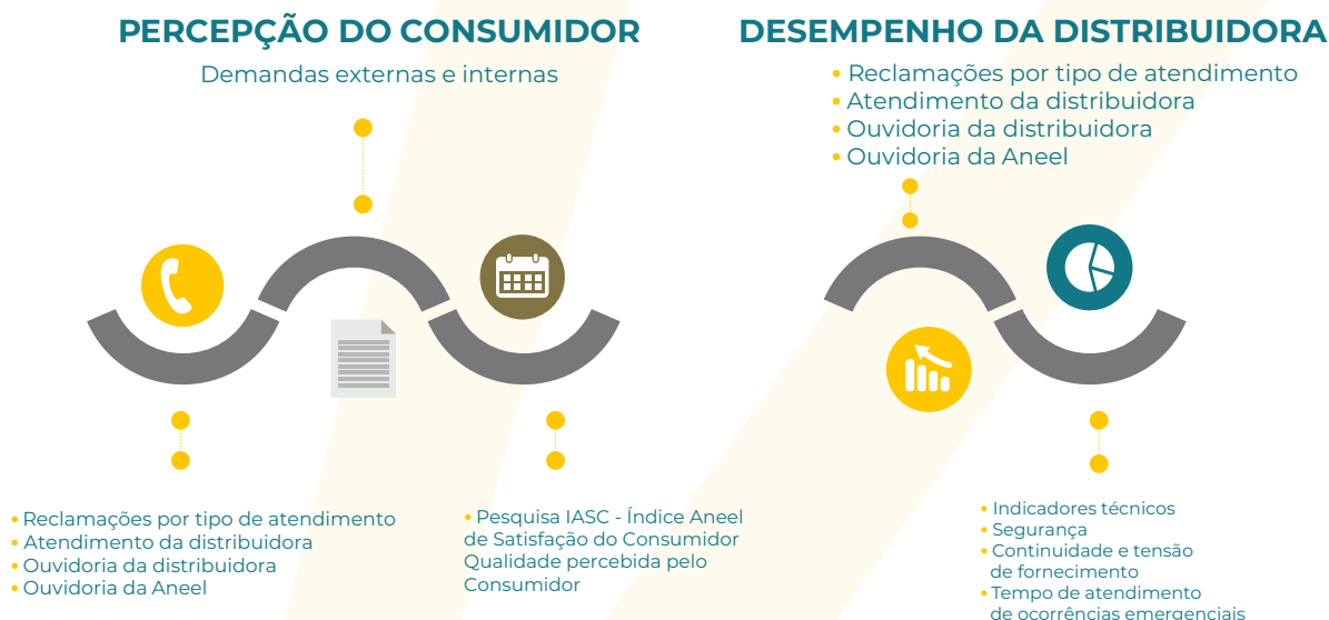
Figura 2: Indicadores para acompanhar o desempenho das distribuidoras

O monitoramento é feito com base na Percepção do Consumidor e no Desempenho da Distribuidora , com fundamento em indicadores estabelecidos para esses dois requisitos, conforme mostra a Figura 2.