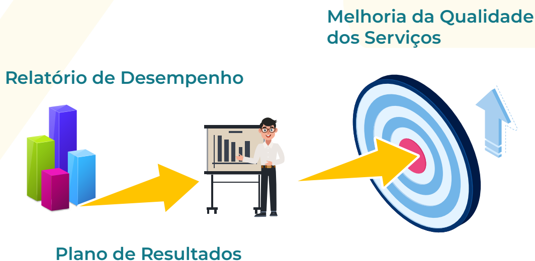
Figura 1: Modelo de fiscalização dos serviços prestados pelas distribuidoras de energia elétrica

O monitoramento é feito com base na Percepção do Consumidor e no Desempenho da Distribuidora , com fundamento em indicadores estabelecidos para esses dois requisitos, conforme mostra a Figura 2.